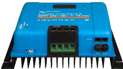
Controlador de carga SmartSolar MPPT 250/100-Tr-VE.Can sin pantalla