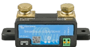
Bluetooth sensing: SmartShunt