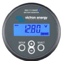
Sensor Bluetooth: Monitor de baterías BMV-712 Smart