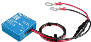
Sensor Bluetooth: Smart Battery Sense