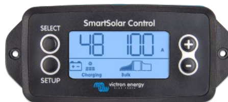
Pantalla enchufable SmartSolar