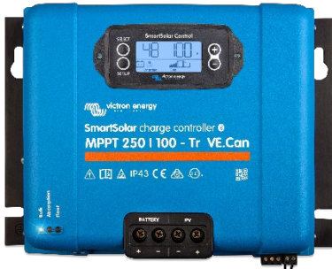
Controlador de carga SmartSolar MPPT 250/100-Tr-VE.Can con pantalla conectable opcional